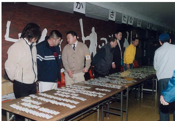
写真1 苗字をあ行、か行…のグループ別に分類しています。 該当するところを目指してください。

※団体登録の場合、原則としてその3人が競技するコートの色は違います。メンバー同志で点数を相殺しないよう別々のコートで競技していただきます。